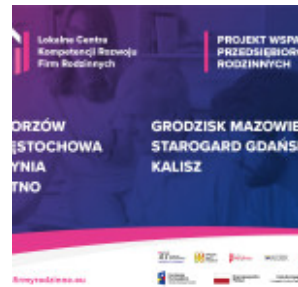
Ogł|Iny baner 1200x900.jpg